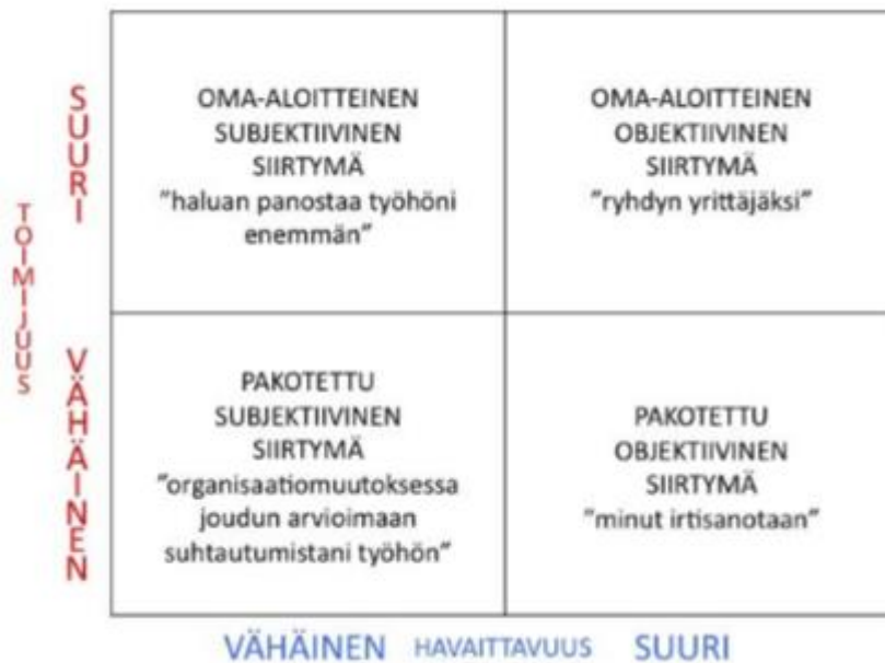
Kuvio 1. Urasiirtymät Koivusen ja hänen tutkijakollegoidensa (2012) mukaan.

olevassa kuviossa on esitetty Koivusen ja hänen tutkijakumppaneidensa (2012) jaottelu.